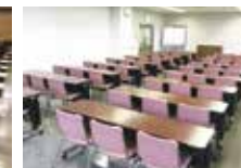
会議室 3 (3F)