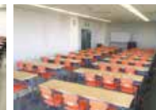
会議室 4 (4F)