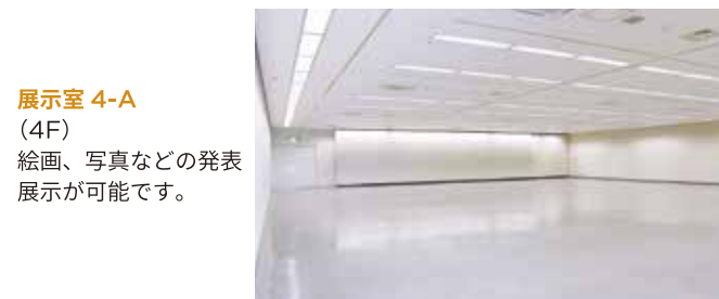
展示室 4-A (4F) 絵画、写真などの発表展示が可能です。