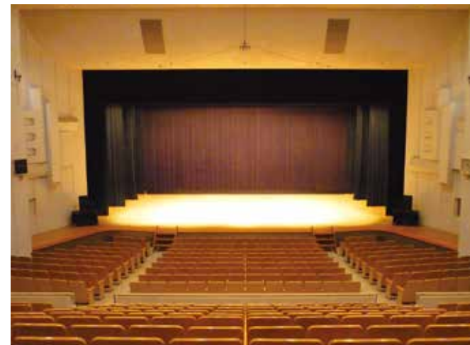
文化ホール (1F) 講演会、音楽演劇に使用可能な多目的ホールです。 固定席は589席(車椅子2席分、介助者1席分)です。