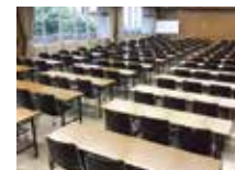
会議室 2 (2F)