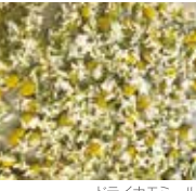
ドライカモミール

大垣特産・生産量日本一のカモミールを煮出し、布を染めてみよう。珈琲で染めた紙を使って、レトロな風合いを活かしたオリジナル作品を作ってみよう。