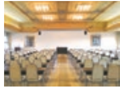
大会議室1 (管理棟3F) 180名収容。講演会、会議等に使用可能です。備付けのスクリーン、音響機器があります。