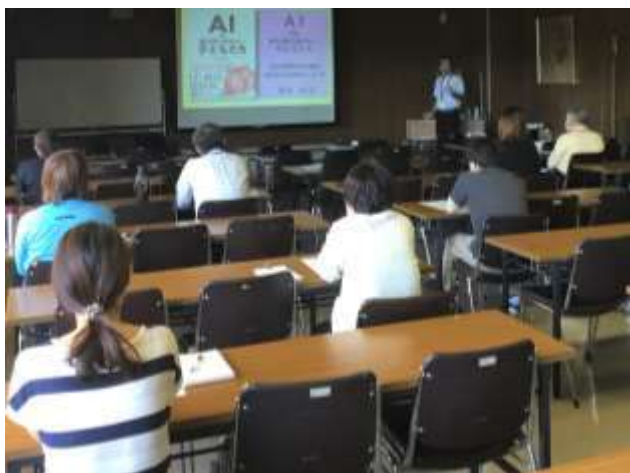
働きやすい職場環境づくりのための研修