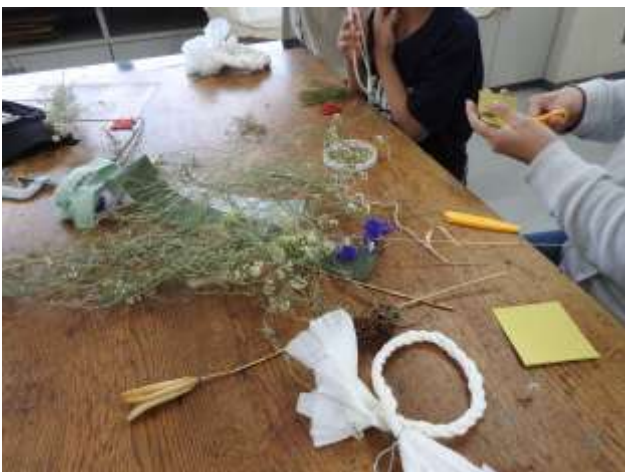
敷地内植物や廃材を利用したワークショップ