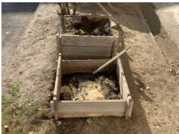
木枠コンポストを使った堆肥作り