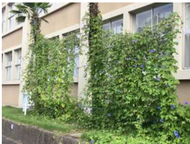
アサガオのグリーンカーテン