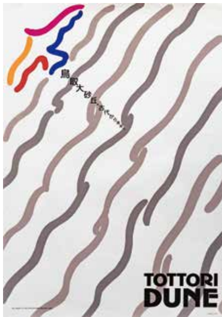
U.G. サトー 〈鳥取砂丘〉