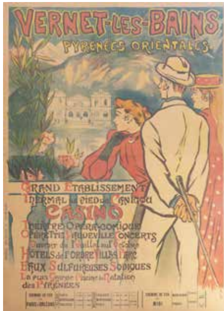
テオフィル・アレクサンドル・スタンラン 〈ヴェルネ-レ-バイン / オリエンタルピレネー〉

日本国際ポスター美術館には、世界各国のデザイナーが制作したポスター約 10,000 点が収蔵されています。その中から、毎年テーマ別にデザインの魅力を紹介するポスター展を開催しています。今回は、「旅」をテーマに、様々な国と地域のイメージポスターや、観光スポットとなる場所や施設、移動手段としての乗物など、多様な視点からポスターデザインを紹介します。 あなたの思い描く世界各地のイメージと、デザイナーの表現を比較しながら、ポスターデザインを通して世界各地を旅してみませんか？