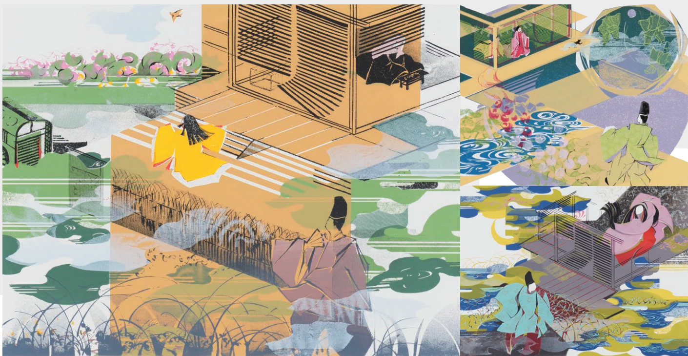
桑原隆一「源氏物語千年紀想」上から時計回りに、第一帖 桐壺 / 第三十四帖 若菜・上 / 第三帖 空蟬 / 第五帖 若紫

大垣市スイトピアセンター（公財）大垣市文化事業団 〒503-0911 岐阜県大垣市室本町5丁目51番地 電話 0584-82-2310 FAX 0584-82-2305 www.og-bunka.or.jp