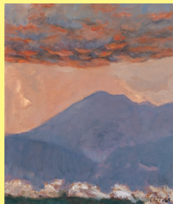
矢橋六郎「伊吹晩秋」