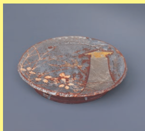
若尾利貞「鼠志野金銀彩台皿」