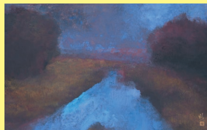
土屋禮一「ふるさとの川」