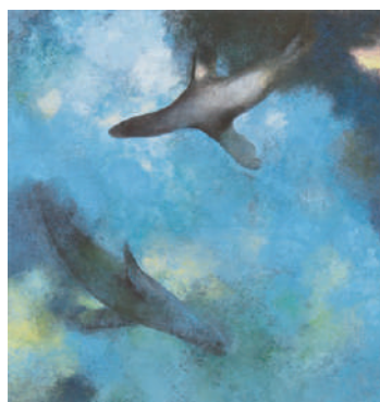
雄飛 2017年 紙本着色