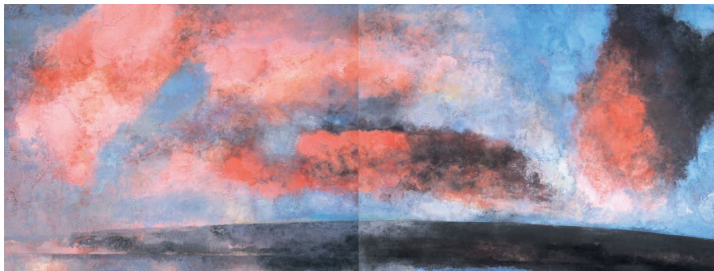
紅雲譜 1996年 紙本着色