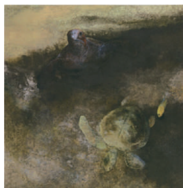
海の哲人 2019年 紙本着色