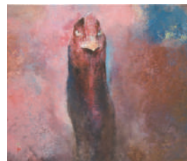
勝鶉 2018年 紙本着色